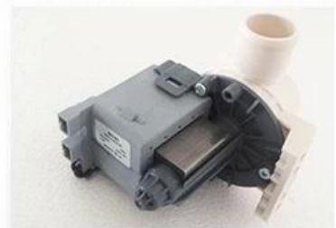
Discharge Pump ( Optional )