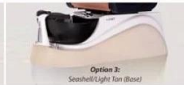
Seashell/ Light Tan ( Base )