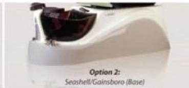
Seashell/ Gainsboro ( Base )