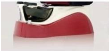
Seashell/ Red ( Base )