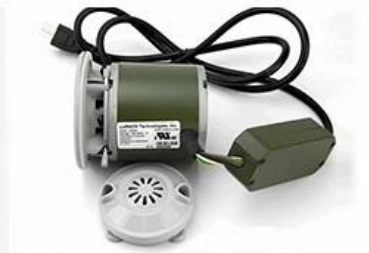
Magnet Jet ( Optional )