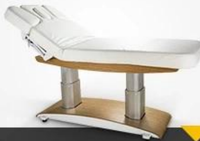
Massage Bed & Massage Table