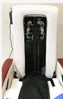
Human Touch Massage