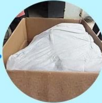
Step2: Wrapping with polly and padding.