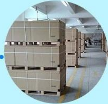
Step3: Ready to ship out.