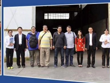
Our group photo with the customer