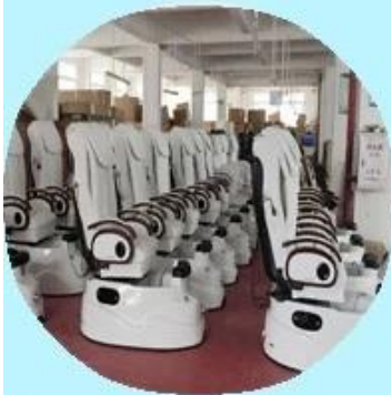
Step1: Test product before packing.