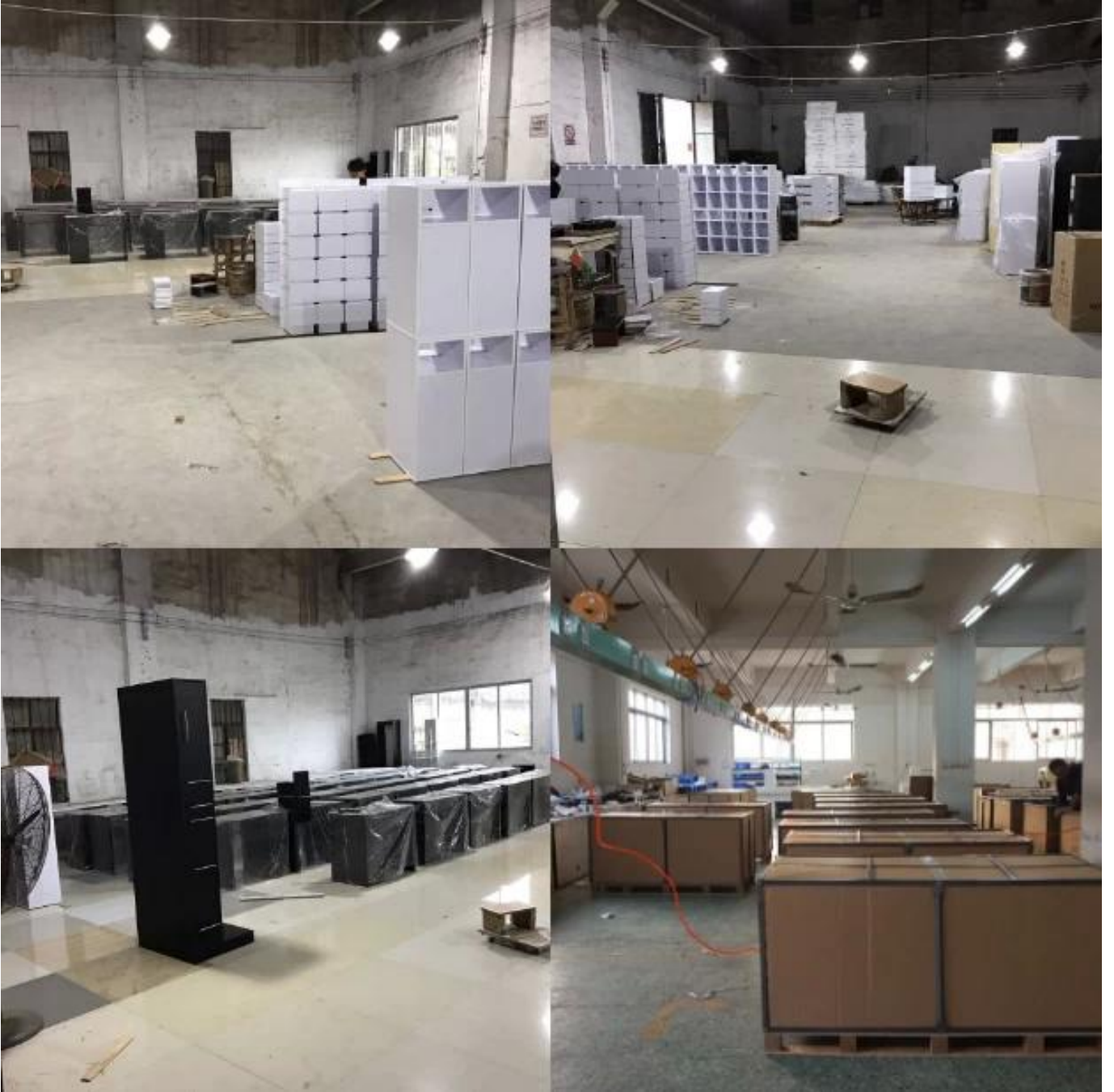
الشحن و التسليم