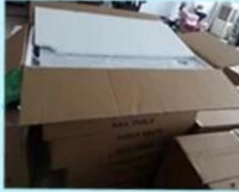
Step2: Wrapping with polly and padding.