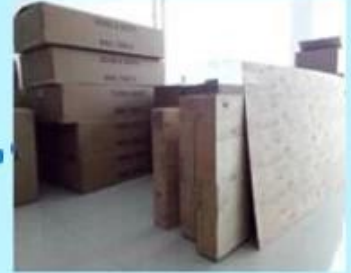
Step3: Ready to ship out.