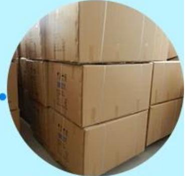
Step3: Ready to ship out.