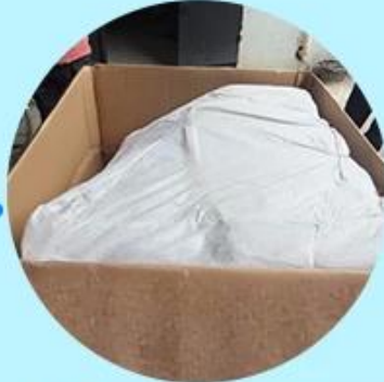
Step2: Wrapping with polly and padding.