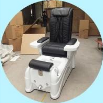
Step1: Test product before packing.