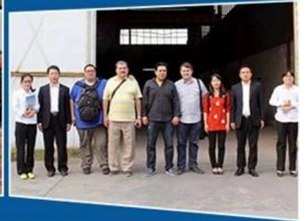
Our group photo with the customer