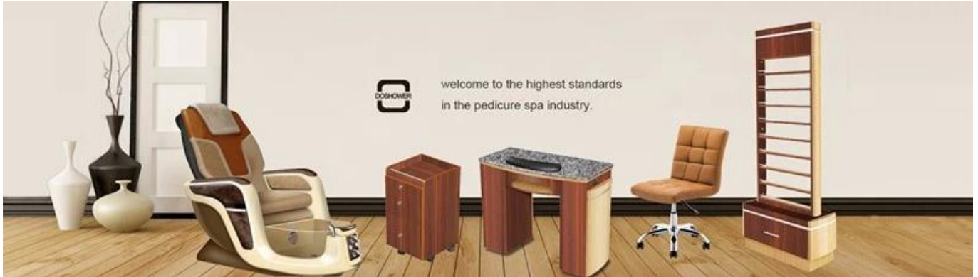
Pantalla del producto