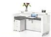
← 前台系列 PECEPTION