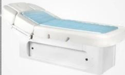
Massage Bed & Massage Table