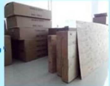
Step3: Ready to ship out.