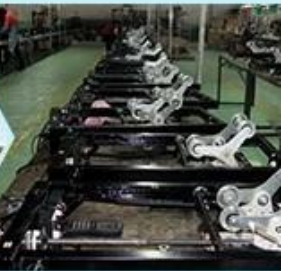
4. The prototype