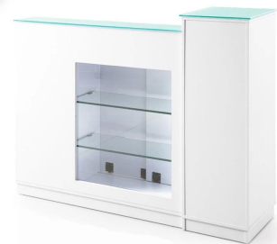
FOSHAN DOSHOWER SANITARY WARE CO., LTD.