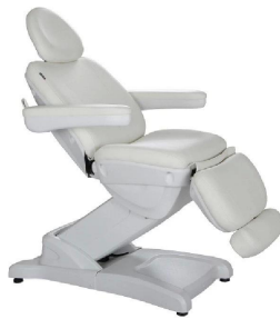
FOSHAN DOSHOWER SANITARY WARE CO., LTD.