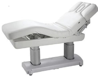
FOSHAN DOSHOWER SANITARY WARE CO., LTD.