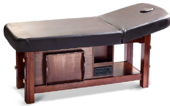
FOSHAN DOSHOWER SANITARY WARE CO., LTD.