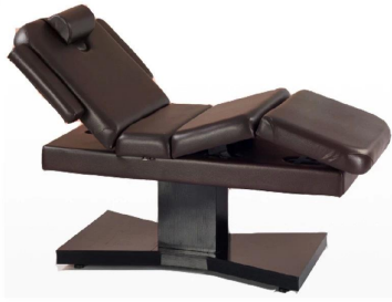
FOSHAN DOSHOWER SANITARY WARE CO., LTD.