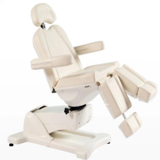
FOSHAN DOSHOWER SANITARY WARE CO., LTD.