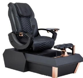
FOSHAN DOSHOWER SANITARY WARE CO., LTD.