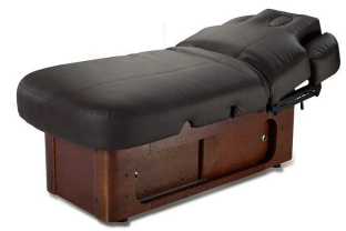
FOSHAN DOSHOWER SANITARY WARE CO., LTD.