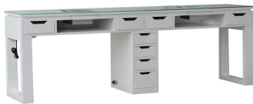
FOSHAN DOSHOWER SANITARY WARE CO., LTD.