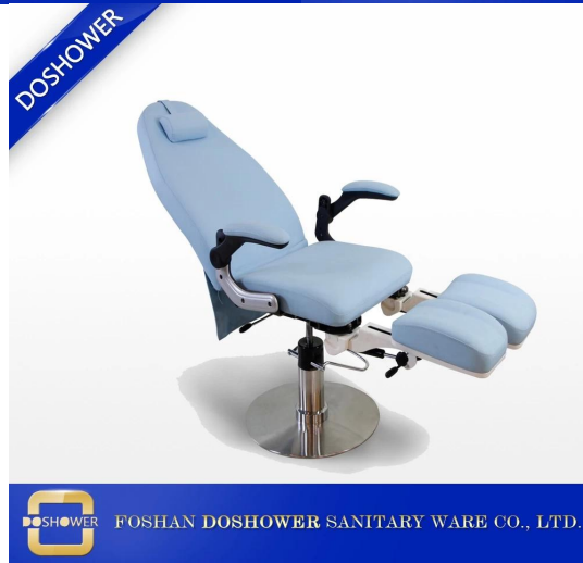
Lit de massage et lit de massage