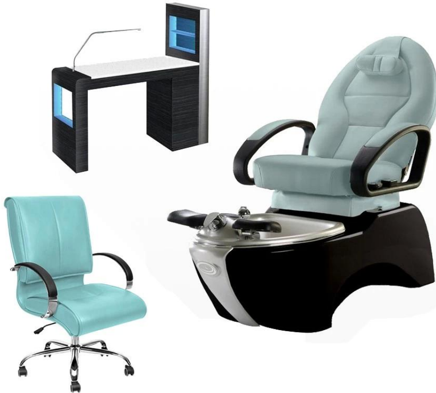
Chaise de pédicure / DS-W17123

Forfait salon (chaise de pédicure, table de manucure, chariot de salon, tabouret de salon)