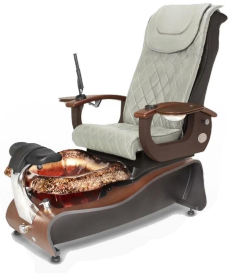
Chariot de salon / DS-BT7