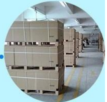
Step3: Ready to ship out.