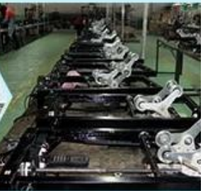
4. The prototype