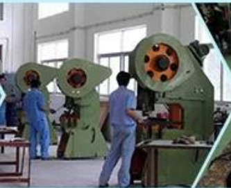
3. Production machinery