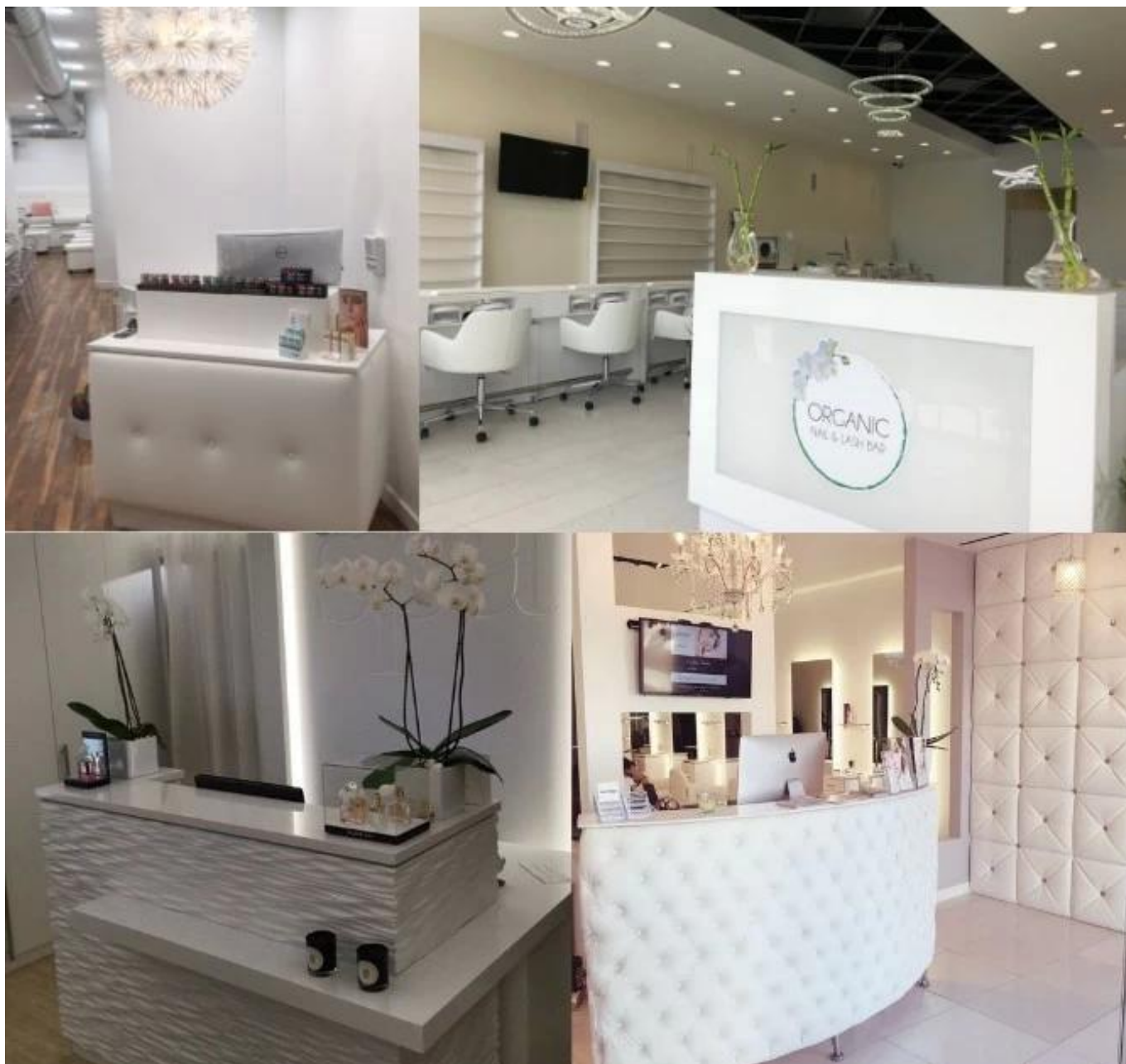
LA NOSTRA FABBRICA