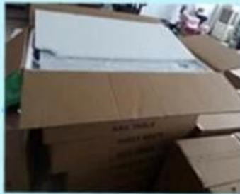
Step2: Wrapping with polly and padding.