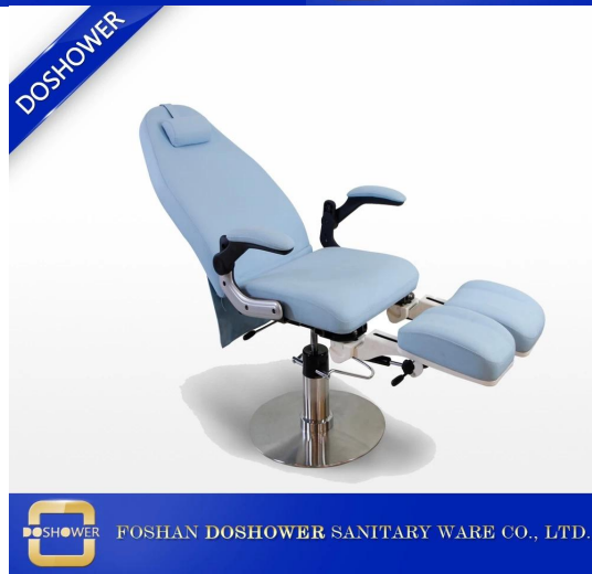
Letto da massaggio e lettino da massaggio