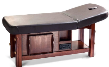
FOSHAN DOSHOWER SANITARY WARE CO., LTD.