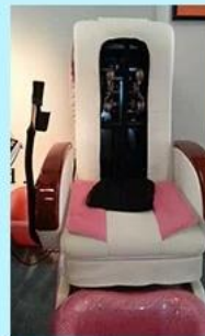
Human touch massage