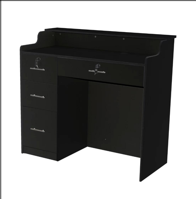
Table Specifications :