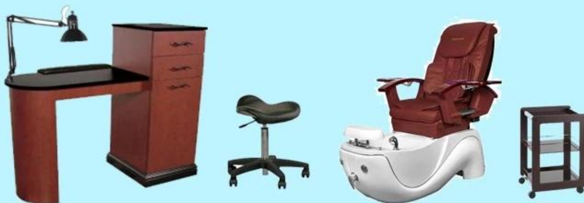
Mesa de manicure com novo design